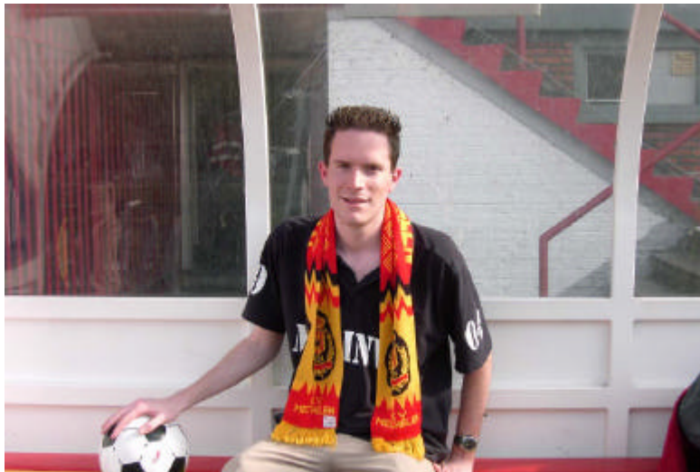
“Je mag de prestaties van Anderlecht in de Champions League niet dramatiseren”

was ontploft. La Louvière verloor de wedstrijd met één doelpunt verschil, nvdr) had men beelden moeten gebruiken, ook wanneer