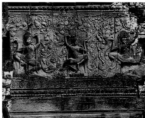
Bas relief du temple d'Angkor

Propos recueillis par Marie- Isabelle Collart