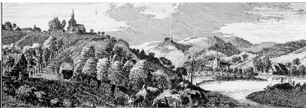
Flawinne en 1740 (gravure aimablement prêtée par M. Goffin, « Au Vieux Quartier », rue de la Halle, à Namur.)

A VEC ses 5.000 habitants, ses 672 hectares et la proximité de Namur (5 km), voici Flawinne, petit village presque sans histoire. Limité par la Sambre au sud, mal relié à la grand-route de Nivelles au nord, il ne dispose que de voies d'accès tortueuses, étroites ou en mauvais état. Au point que, pour les étrangers, se rendre à Flawinne est presque une aventure. Et un test sérieux pour les amateurs de voitures. Simple hasard, volonté délibérée, ou tout simplement relief d'un étonnant esprit d'indépendance ? Flawinne est-il une île ? Telle est la question que d'aucuns n'hésitent pas à poser.