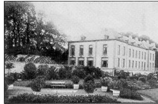
Le château de Flawinne : Louis XIV y installa son quartier général lors du siège de Namur en 1692.

pale voie de l'ouest namurois pour le transit de marchandises. En rêvant un peu, on peut revoir, à hauteur de Flawinne, les convois chargés de charbon, de boisson, de houille, de fagots, de chaux, de céréales, ou encore de vin ou de bière bras-