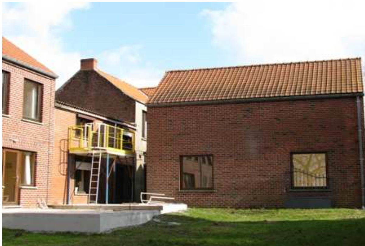
Une vue de l'extérieur de la structure. Vue de l'arrière avec une pelouse de +/- 20 ares.