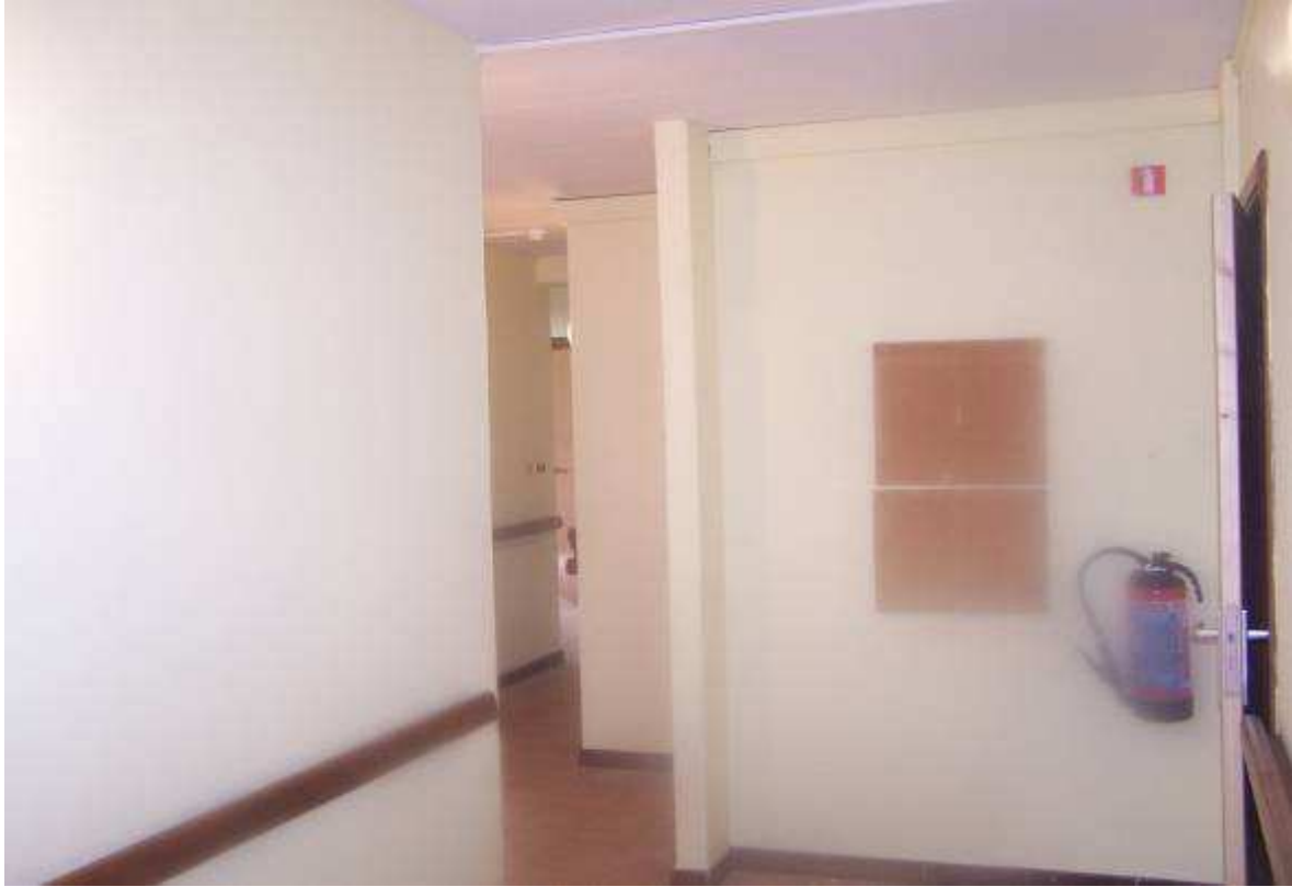
Les halls des chambres de la structure.