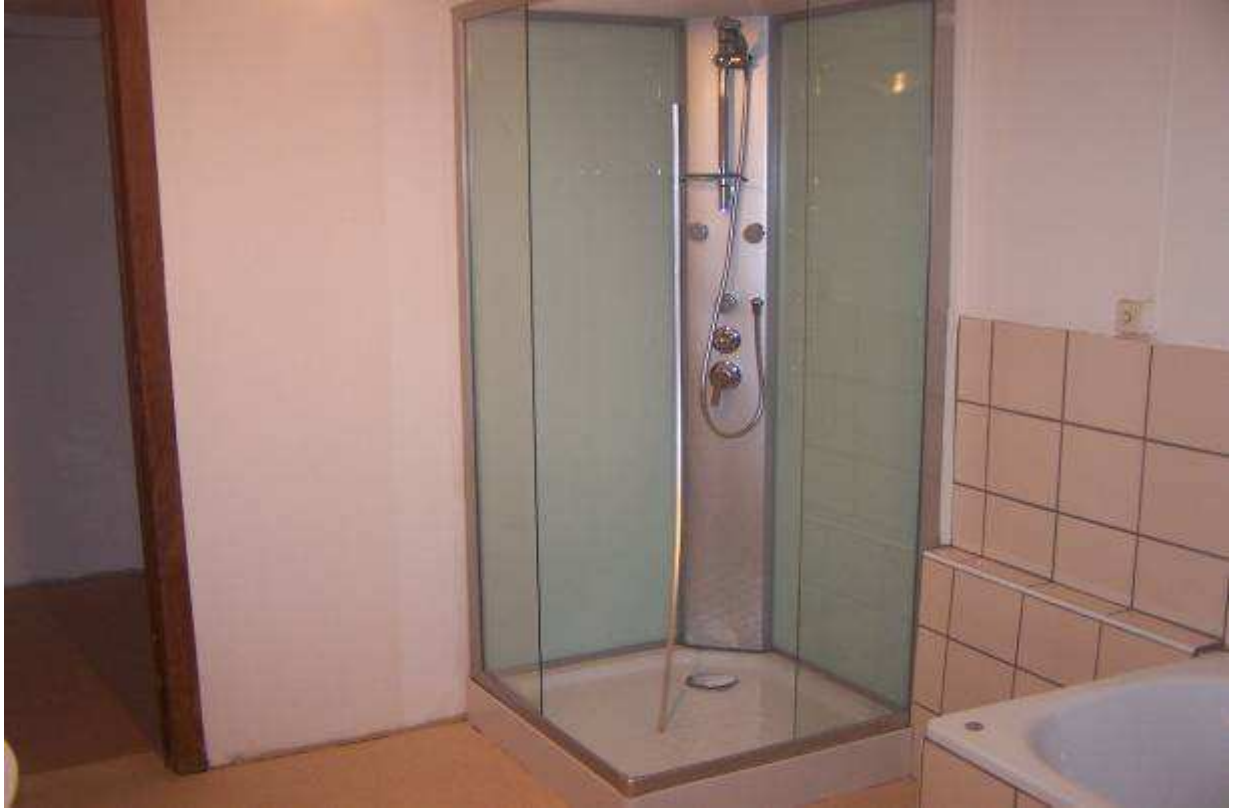
Salle de bain n°2.