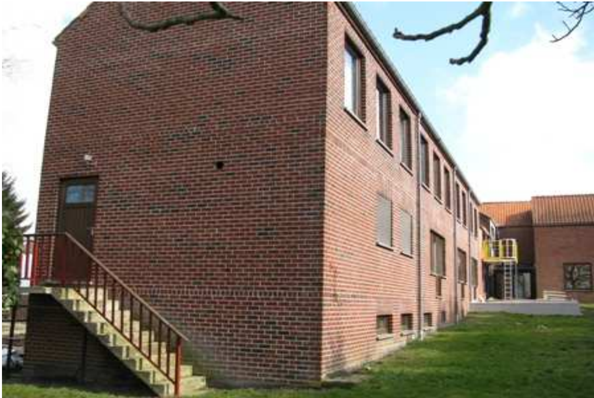
Une vue sur le côté arrière de la structure avec une sortie de service.