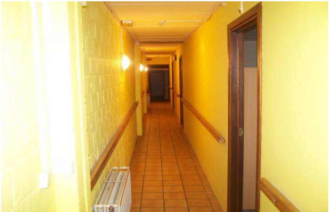
Un hall d'accès aux chambres de l'aile droite.