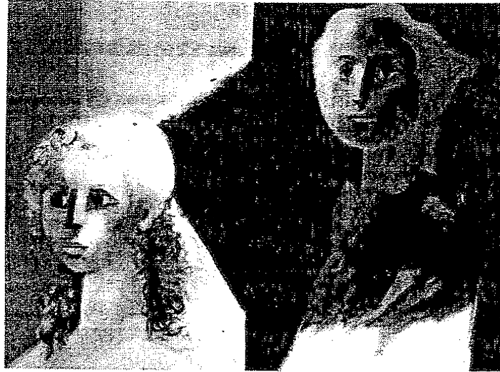
Une œuvre de Roger Somville

Cette année l'association présentera, dans l'enceinte du Château du Karreveld, une exposition-vente d'œuvres contemporaines. Pour concrétiser son projet, Kids'Hope a reçu le soutien de plusieurs artistes qui ont accepté de céder une partie du produit de leurs ventes au profit de l'asbl.