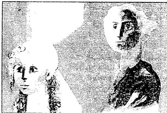
Une œuvre présentée: "A l'atelier, devant un tableau commencé" (© R. SOMVILLE 1997)

PRATIQUE > Château du Karreveld. Du 22 au 30/11, de 11 à 19h. Entrée gratuite. Infos: 02/469 03 82.