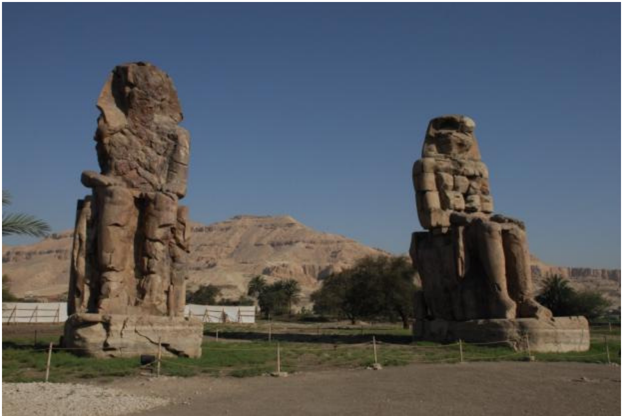
De Memnonkolossen met hun graffiti