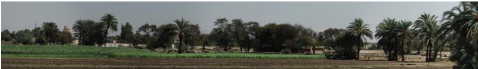
Figure 1: Zicht op de tempel van de restanten van de dodentempel van Amenhotep III vanaf de tempel van Merneptah. Links tussen de bomen is een van de Memnonkolossen zichtbaar.

Beide kolossen waren reeds sinds de oudheid een toeristische attractie en staan vol met allerlei graffiti.